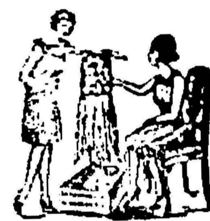
„Timana andjeun ngongkonkeun njeuseuh injelep sakieu saena?“

Stationsweg No. 30 TASIKMALAJA Naust GEBEO.